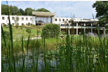
4 Sterne Superior Schlosspark Mauerbach