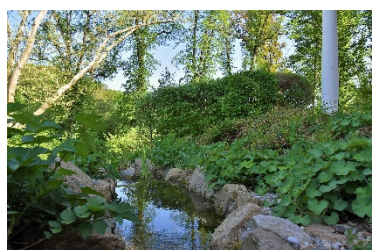
Schattige Ruheoasen im Park